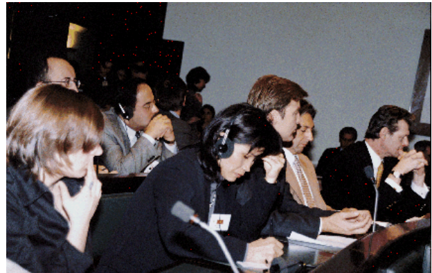
De handelsattachés vergaderen in het Parlement

Een aantal attachés hebben bij deze gelegenheid verklaard dat zij menen dat hun opdracht soms het economische kader mag overstijgen om het Hoofdstedelijk Gewest te vertegenwoordigen en in alle opzichten "aan de man te brengen".