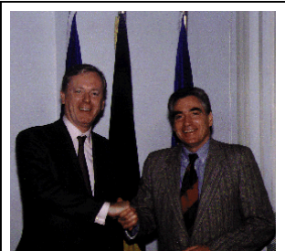
De voorzitter van het Brussels Parlement, senator Armand De Decker, heeft op 19 januari de voorzitter van de Roemeense Senaat, de heer Petre Roman, ontvangen.

In een volgende nieuwsbrief verneemt u meer over de andere afdelingen van de parlementaire diensten die onmisbaar werk leveren voor het Hoofdstedelijk Parlement.