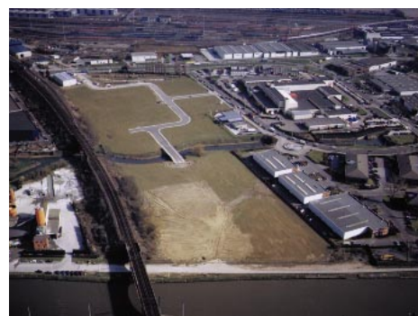
Het industrieel terrein aan de Aakaai in Anderlecht: om nieuwe ondernemingen te huisvesten; een realisatie van de gewestelijke ontwikkelingsmaatschappij GOMB.

Inzake economische ontwikkeling is de GOMB belast met de bevordering van de oprichting en de ontwikkeling van ondernemingen in ons Gewest, in het bijzonder door de vestigingsmogelijkheden te vergroten, door bedrijvenzones en bedrijfsgebouwen te beheren en door betere informatiediensten uit te bouwen.