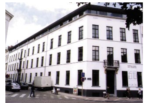
Hoek Fernand Cocqplein - Mercelisstraat, een realisatie van de GOMB.

in gebieden waar een tekort aan woningbouw wordt vastgesteld. Die woningen moeten in een meerjarenplan opgenomen zijn, dat met name de projecten, de middelen, de betalingswijze en de vestigingsplaats vastlegt.