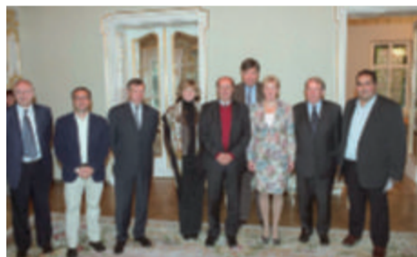
De delegatie van het Bureau van het Brussels Parlement ontvangen door de voorzitter van het Lets Parlement, mevrouw Ingrida Udre.

Naast ontmoetingen met de gezagdragers van de drie parlementen, hebben de delegatieleden ook gesprekken gevoerd met prominenten uit de economische, sociale en culturele middens van deze landen, die recentelijk zijn toegetreden tot de Europese Unie en de NAVO.