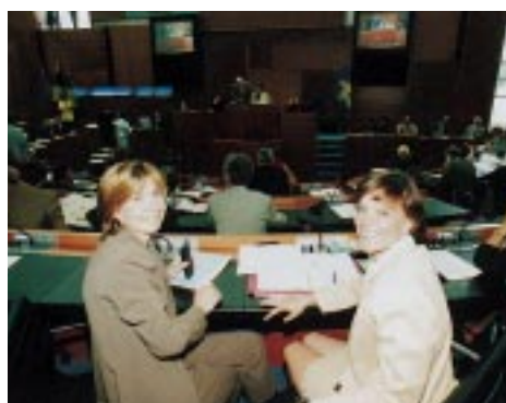
Een parlement met veel wat jonge en vrouwelijke leden.