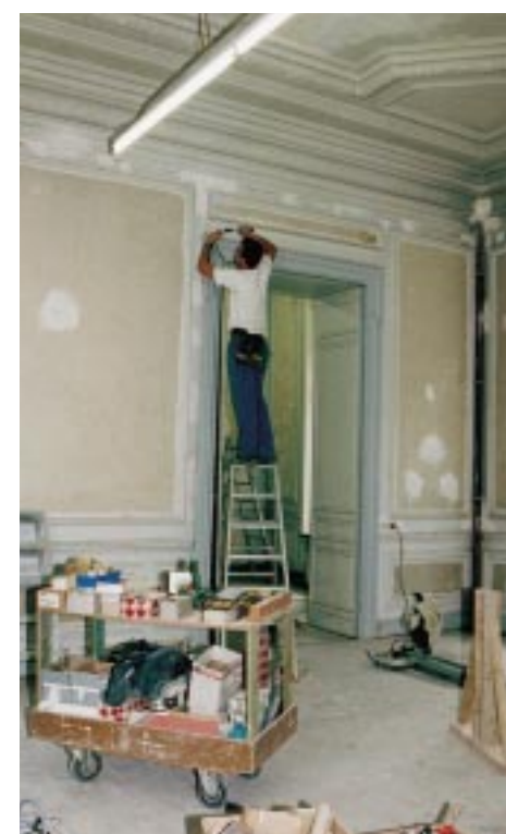
De laatste fase van de verbouwingswerken.

2000. Dan zou het hele gebouw, met inbegrip van de historische salons, volledig vernieuwd moeten zijn.